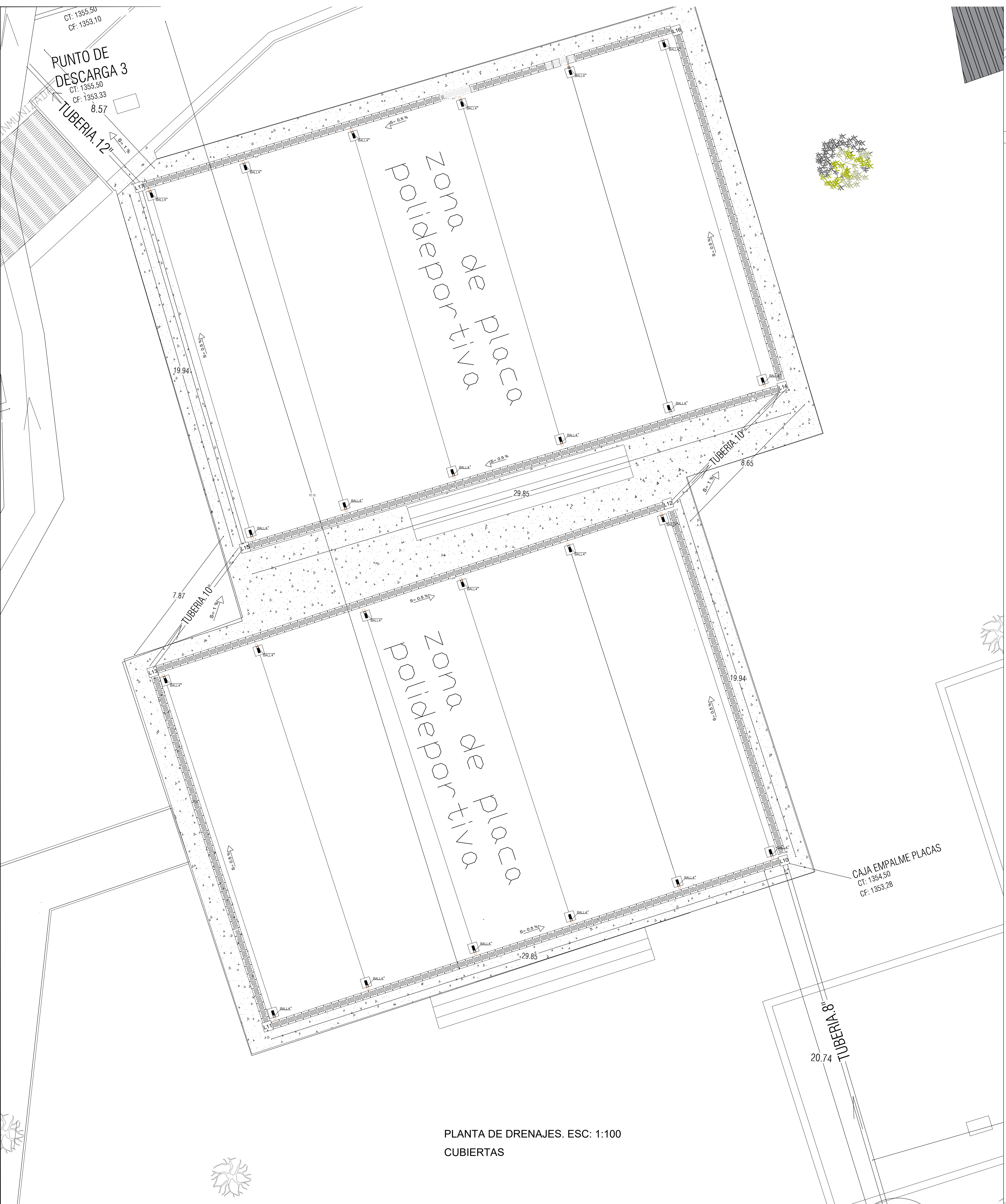
PLANTA DE DRENAJES. ESC: 1:100 CUBIERTAS